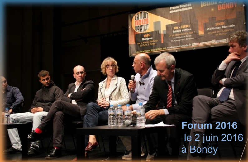
Forum 2016 le 2 juin 2016 à Bondy